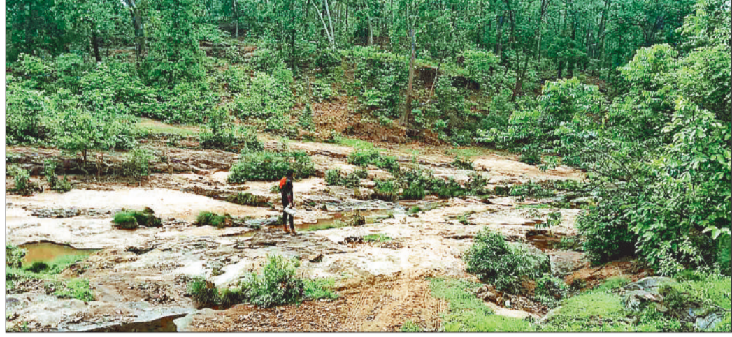
प्रस्तावित निर्माण स्थल।

प्राकृतिक संसाधनों की दृष्टि से बेहद समृद्ध विकासखण्ड ओड़गी के दूरस्थ गांवों के विकास में नदी-नाले जंगल व पहाड़ बाधा बने हुए हैं। अन्य दिनों में तो ग्रामीण जैसे-तैसे अपनी जरूरतें पूरी कर लेते हैं लेकिन बरसात के दिनों में कई गांव टापू बन जाते हैं। आवागमन की सुविधाओं के अभाव में जिला एवं विकासखण्ड मुख्यालय पहुंचना तो दूर आसपास के गांवों में जाने के लिए भी ग्रामीणों को कड़ी मशकत करनी पड़ती है। कुछ ऐसे गांव भी हैं जो नदी-नालों से घिरे हैं तथा पुल-पुलियों का निर्माण हुए बिना ग्रामीणों के लिए आवागमन करना आज भी बड़ी चुनौती बना हुआ है। कहीं ग्रामीण डोंगी के भरोसे आवागमन कर रहे हैं तो कहीं पैदल नालों को पार कर। पुल-पुलियों के अभाव में इन गांवों का विकास अवरूढ़ हो गया है। ग्रामीण लम्बे अरसे से पुल-पुलियां का निर्माण कराने की मांग कर रहे हैं। कुछ स्थानों पर पुल-