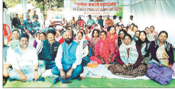
शांतिपूर्ण रहा प्रदर्शन: उपवास कार्यक्रम पूरी तरह शांतिपूर्ण रहा। कांग्रेस नेताओं ने मनरेगा को मजबूत करने, मजदूरी का समय पर भुगतान सुनिश्चित करने और ग्रामीण क्षेत्रों में पर्याप्त रोजगार उपलब्ध करने की मांग करते हुए सरकार का ध्यान मजदूरों की समस्याओं की ओर आकृष्ट किया।

उपवास के दौरान वक्ताओं ने कहा कि महात्मा गांधी के विचारों से प्रेरित मनरेगा योजना आज ग्रामीण भारत की जीवनेरखा बन चुकी है। कांग्रेस नेताओं ने सरकार पर सीधा हमला बोलते हुए कहा कि आज गांधी में हालात चिंताजनक हैं। मजदूरों को न तो समय पर काम मिल पा रहा है और न ही उनकी मेहनत की मजदूरी समय पर दी जा रही है। कई स्थानों पर