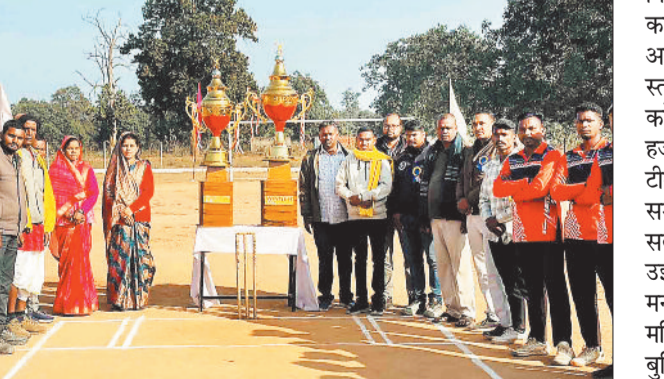
खिलाड़ियों के साथ अतिथि।

प्रतियोगिता में भाग लिया। फाईनल मैच सरपंच 2.0 एवं ब्लैक डायमंड के बीच खेला गया जिसमें टॉस जीतकर सरपंच 2.0 द्वारा शानदार बल्लेबाजी करते हुए 12 ओवर में 136 रनों का लक्ष्य दिया। टीम के रंगा द्वारा 6 छक्कों के मदद से 48 रन बनाया। इधर लक्ष्य का पीछा करने उतरी ब्लैक डायमंड की टीम ने धुंधधार शुरुआत की और 11.3 ओवर में 3 विकेट खोकर यह लक्ष्य को हासिल कर प्रतियोगिता अपने नाम की। ब्लैक डायमंड की